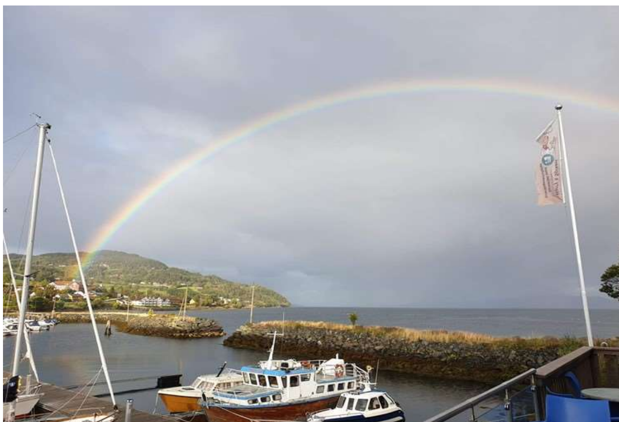
Regnbuen omkranser havneområdet i Leksvik

Hovedkontor Rissa: mandag – fredag 09:00 – 15:00 Bankkontor Leksvik: mandag – fredag 09:00 – 15:00