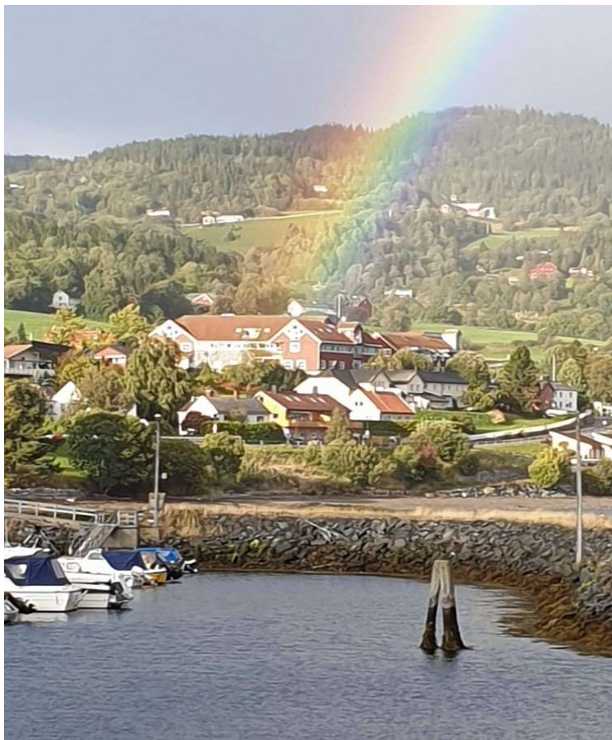
Bankens lokasjon i Leksvik sett fra havneområdet